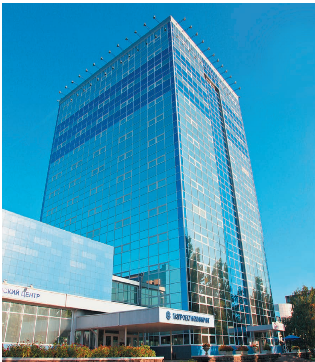
Главный офис ДООАО «Газпроектинжиниринг» (Воронеж)