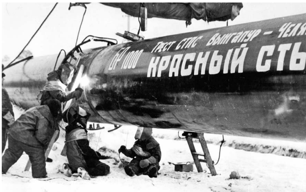
Сварка магистрального газопровода Вынгапур – Челябинск. 1970-е годы.

расплавления металла, однако прошло больше восьмидесяти лет, прежде чем явление электрической дуги было использовано на практике для сварки металлов нашими соотечественниками Н.Н. Бенардосом и Н.Г. Славяновым, которые первыми в мире применили «дугу Петрова». Газовую сварку для изготовления неосновных деталей паровых котлов комиссия при Министерстве торговли и промышленности России разрешила лишь в 1911 году.