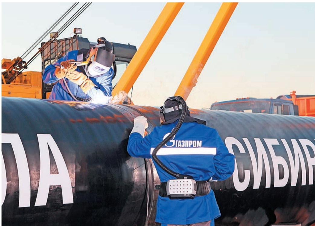
Сварка первого стыка газотранспортной системы «Сила Сибири». 2014 год.

Стремительное развитие сварки началось в конце позапрошлого века. В 1802 году профессор В.В. Петров открыл явление электрической дуги – один из видов электрического разряда в газовой среде. Он впервые показал, что между сближенными угольным и металлическим электродами, находящимися под током, происходит явление, которое теперь наблюдают при электросварке. Петров рекомендовал применять электрическую дугу как источник тепла для мгновенного