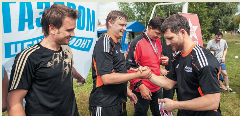
Награждение серебряных призеров – команды администрации и УКЗ