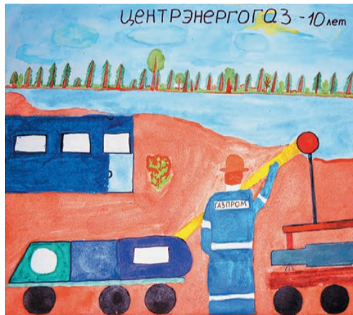
«Рабочие будни папы». Рисунок Златы Голдобинной