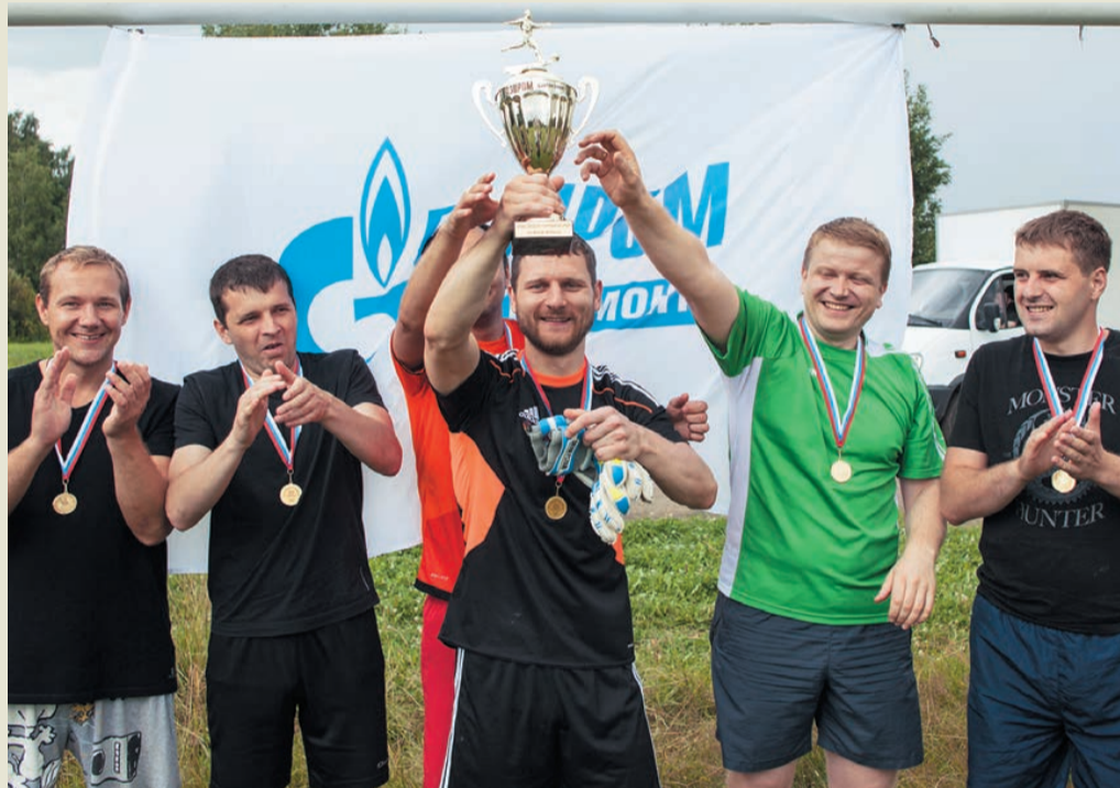
Кубок в руках победителей