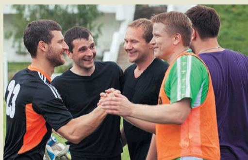
Игроки благодарят друг друга за хорошую игру