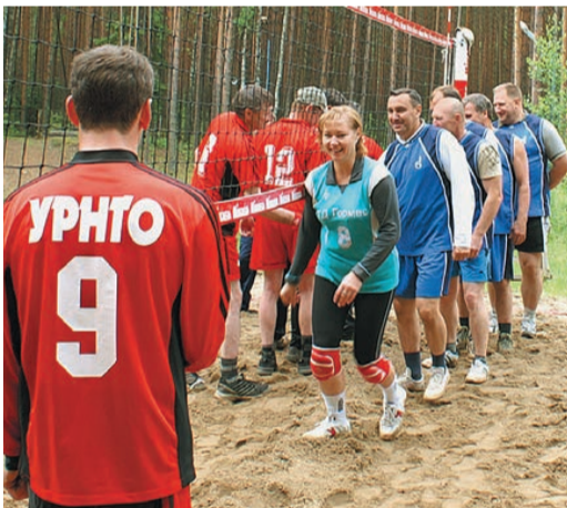
Перед товарищеским волейбольным матчем