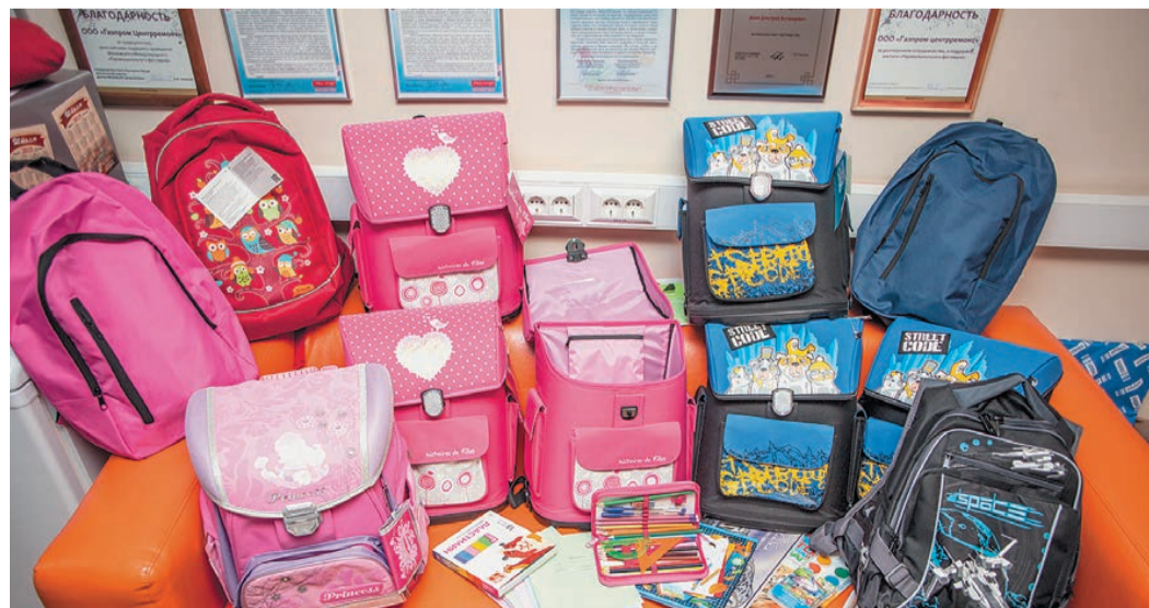
Гуманитарная помощь готова к отправке