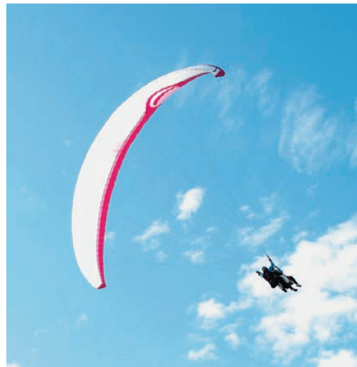
Парапланы на высоте птичьего полета