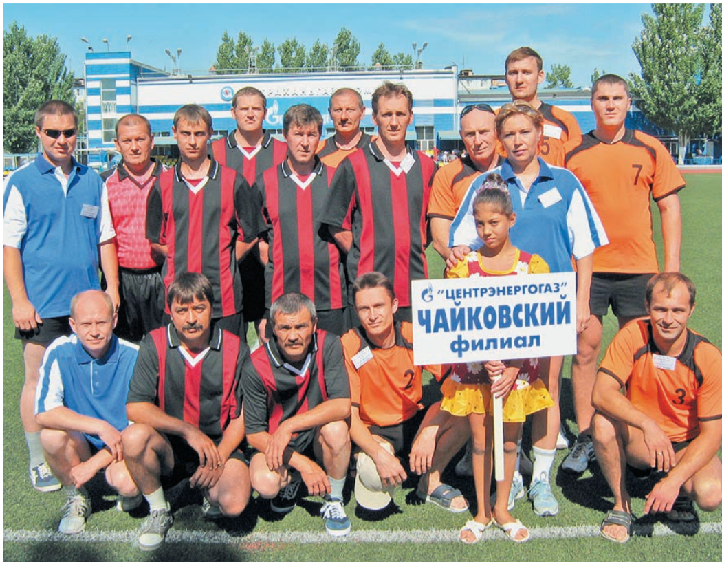
Футболисты филиала «Чайковский» в сборе

В филиале «Чайковский» ДОО «Центрэнергогаз» 1 августа прошли праздничные мероприятия, посвященные 10-летию со дня образования филиала. Главным событием стала традиционная летняя спартакиада, которая проводится в филиале с 2007 года.