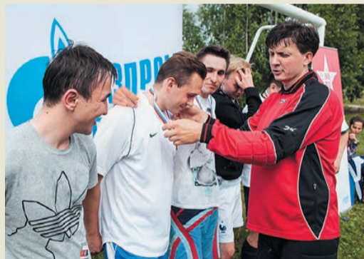
Бронза – команде управления пусконаладочных работ