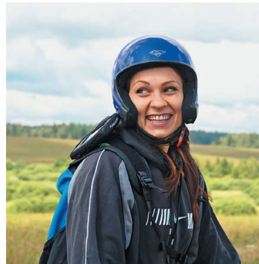
Позитивные эмоции участников полета

Около 40 сотрудников ООО «Газпром центрремонт» приняли участие в проекте «Полет на параплане», организованном профсоюзной организацией и Советом молодежи компании.