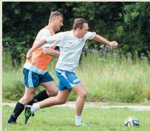
Борьба за мяч – каждую секунду

Итоги выступления каждой команды подводили по сумме очков, набранных в трех играх. В результате интересной и бескомпромиссной борьбы третье место завоевали футболисты управления пусконаладочных работ. Второе место присуждено игрокам сборной команды администрации и управления корпоративной защиты. А победителем, обладателем переходящего кубка корпоративного турнира, а также специальных призов в честь 70-летия Великой Победы стала команда управления мониторинга.