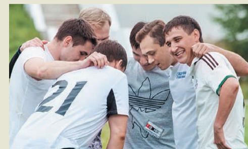
Тактическая установка перед матчем