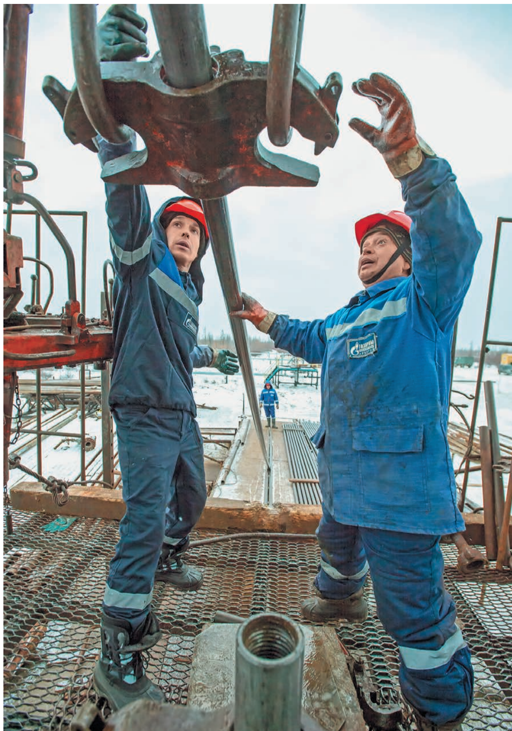
Спуско-подъемные операции на устье скважины на Юбилейном НГКМ выполняет бригада капитального ремонта скважин № 1 ЦКПРС-2 Надымского УИРС ООО «Газпром подземремонт Уренгой»