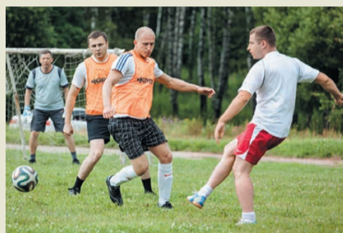
В обороне не зевай