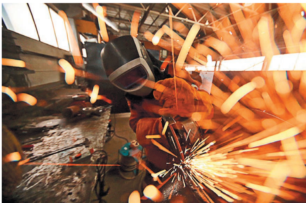
От искр сварщика сегодня надежно защищает специальная маска.