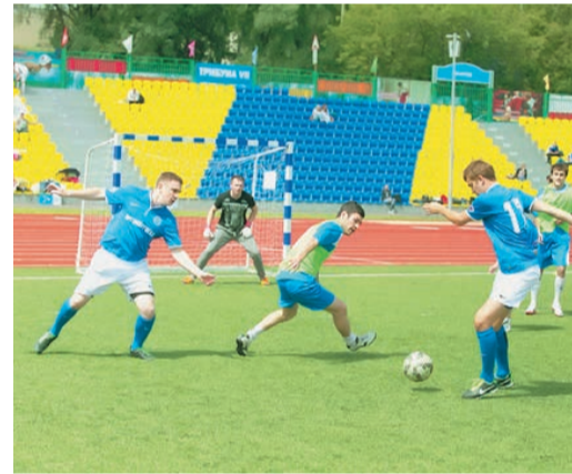
Команда ОАО «Оргэнергогаз» борется за победу