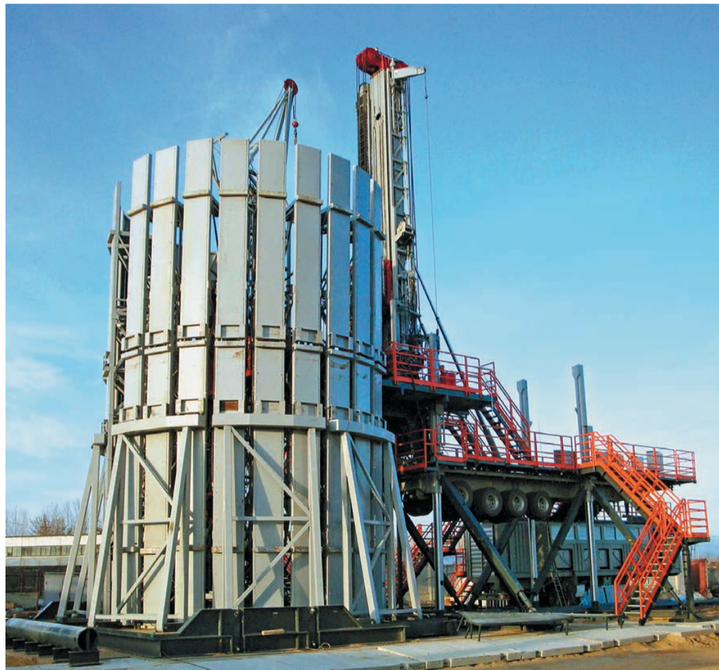
Гидравлическая установка Drillmes. Астраханское УИРС ООО «Газпром подземремонт Оренбург»