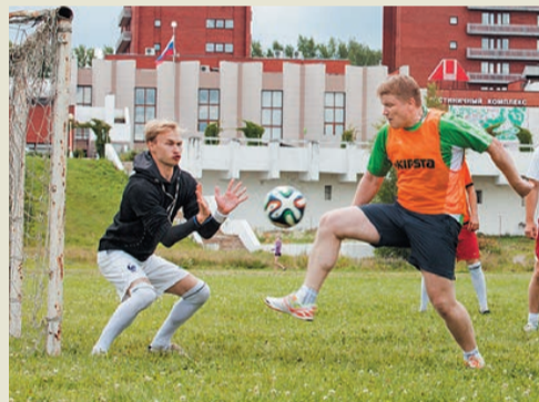
Вратарь на месте