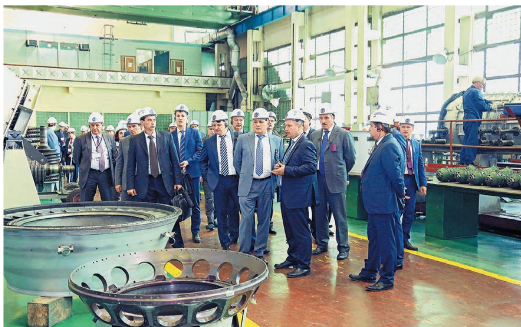
Демонстрация готовой продукции