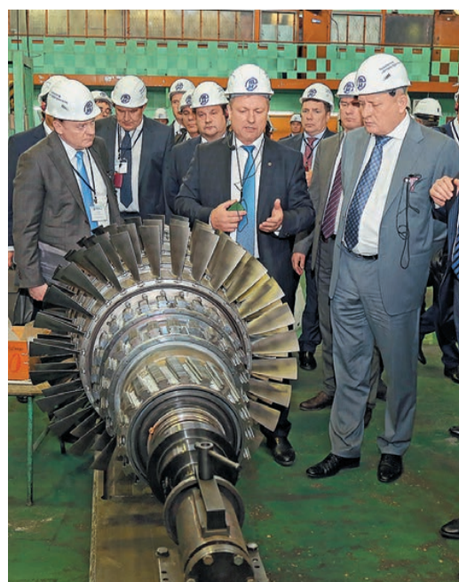
О ремонте газотурбинных двигателей