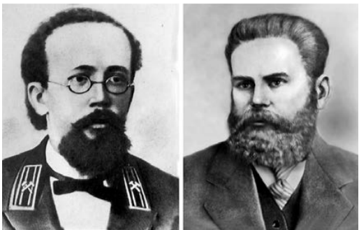
«Отцы» сварки – русские ученые Н.Г. Славянов и Н.Н. Бенардос

Роль сварки в современной промышленности очень велика – на сегодняшний день известно более сотни ее способов. В газовой отрасли сварочные работы востребованы особенно остро: в обслуживании объектов газовой отрасли применение сварочных технологий занимает ключевые позиции.