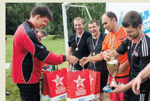
Специальные призы победителям турнира