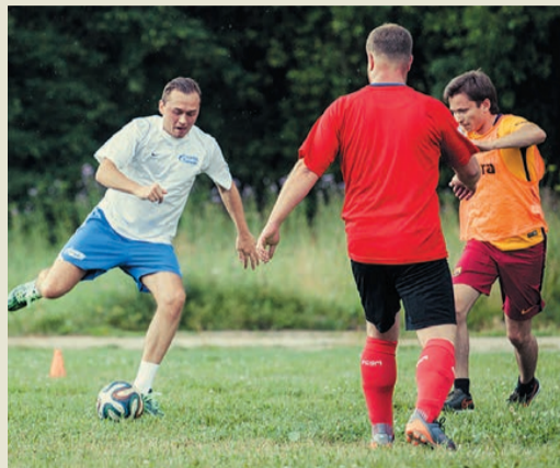
Воля к победе – самое главное