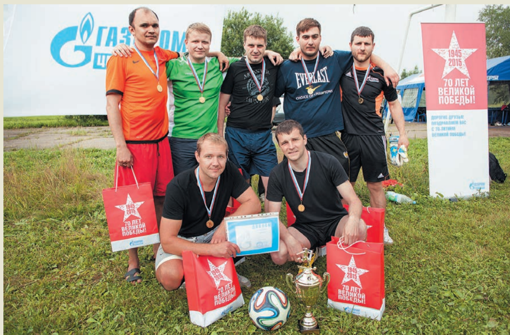
Победители турнира – команда управления мониторинга