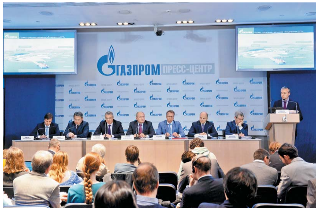
В ходе пресс-конференции «Газпром» на Востоке России, выход на рынки стран АТР»

В ходе пресс-конференций, предвещающих годовое Общее собрание ОАО «Газпром», были подробно обсуждены перспективы деятельности компании на европейском рынке и в Азиатско-Тихоокеанском направлении, что особенно актуально с учетом внешнеполитических факторов и недавнего подписания долгосрочного контракта с Китаем.