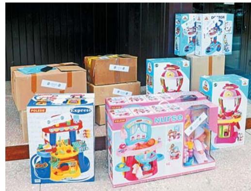
Подарки от моторостроителей