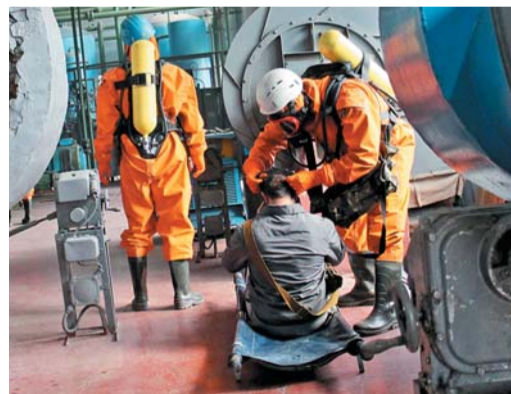
Эвакуация «пострадавшего» с места аварии