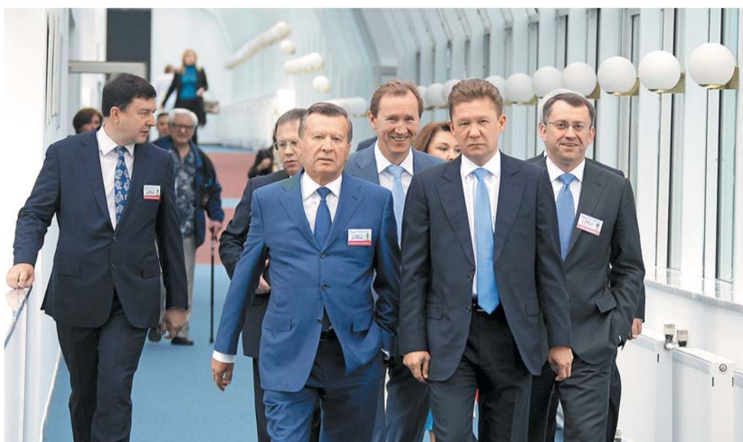
Виктор Зубков, Алексей Миллер и Михаил Середя

27 июня в Москве состоялось годовое Общее собрание акционеров ОАО «Газпром», в котором приняли участие акционеры из России и ряда зарубежных стран. На собрании был утвержден годовой отчет, приняты решения о распределении прибыли по итогам прошедшего года, размере и сроках выплаты дивидендов, избраны члены Совета директоров и ревизионной комиссии, а также был рассмотрен ряд других традиционных вопросов повестки. В ходе собрания с докладом об итогах деятельности компании в 2013 году перед собравшимися выступил Председатель Правления ОАО «Газпром» Алексей Миллер.