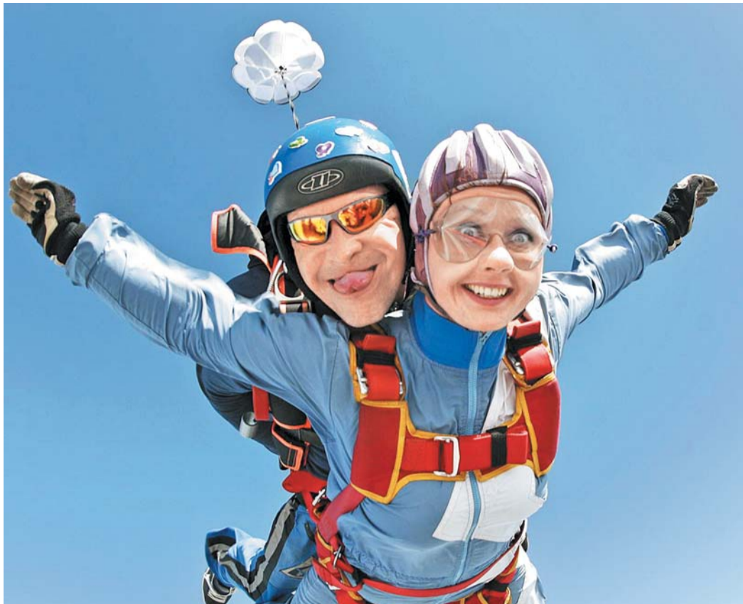
Забудьте о стрессе!

Если вы визуалист, как в первом случае, попробуйте снимать стресс, окружая себя успокаивающими и поднимающими настроение изображениями. Вы также можете попробовать закрыть глаза и представить себе