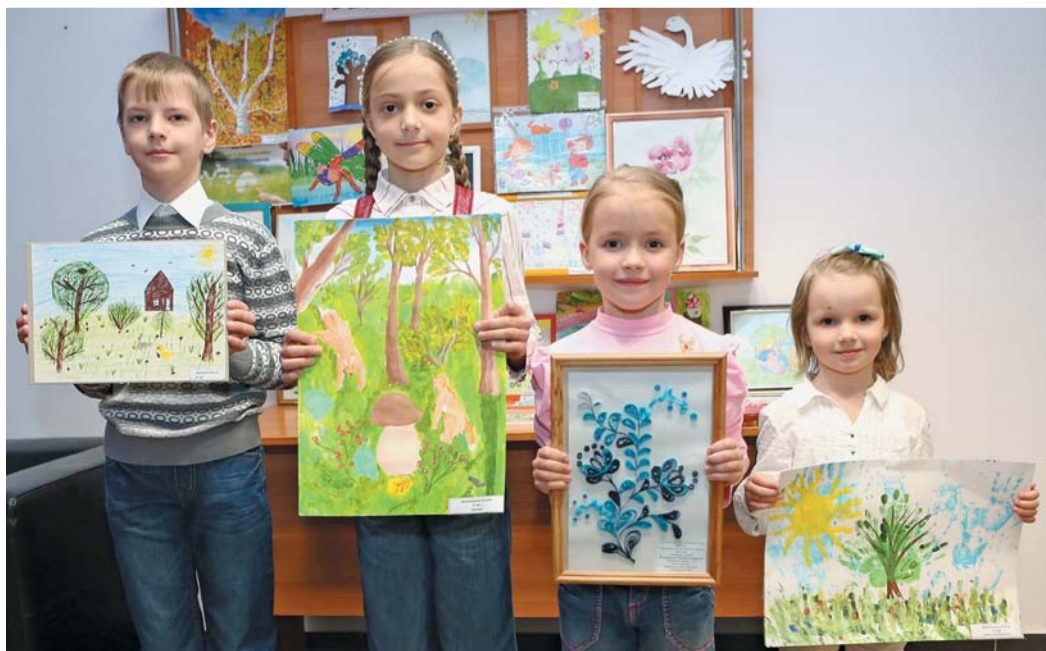
Призеры конкурса «Красота моей планеты»