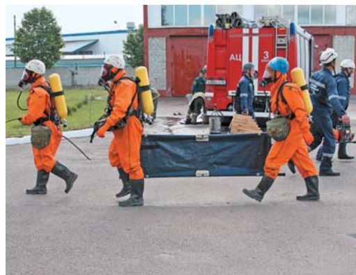
Работа специальных служб