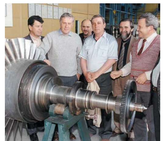
В Сургутской ремонтно-механической мастерской