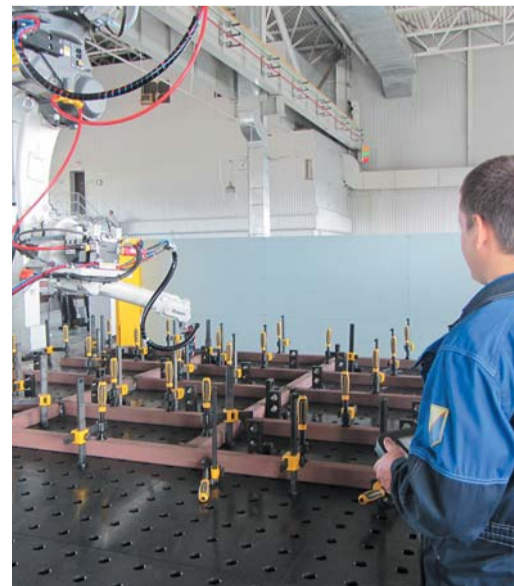
Филиал «Афимэлектрогаз» ДОО «Электрогаз». Роботизированный сварочный комплекс