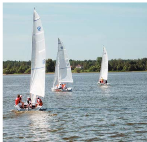
Под парусом с попутным ветром!