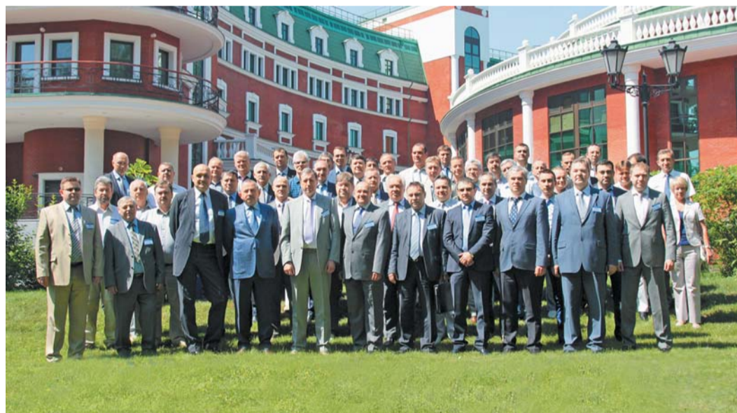
Участники совещания главных энергетиков

В начале июня в Москве прошло 46-е ежегодное совещание главных энергетиков дочерних Обществ ОАО «Газпром», организованное Управлением энергетики Департамента по транспортировке, подземному хранению и использованию газа ОАО «Газпром» совместно с ОАО «Оргэнергогаз».