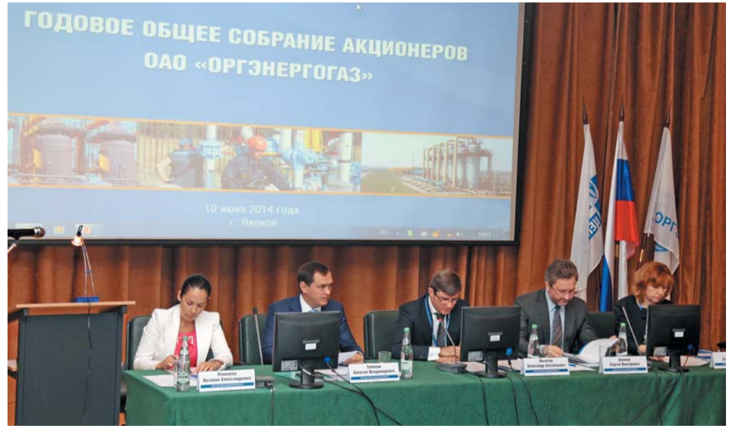
Президиум годового Общего собрания в ОАО «Оргэнергогаз»