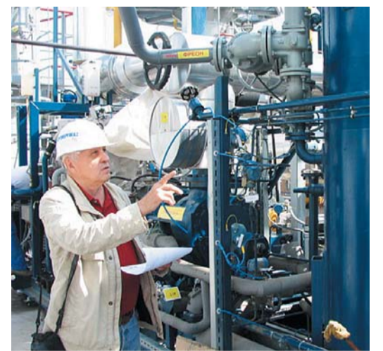
Пусконаладочные работы на КС «Портовая»