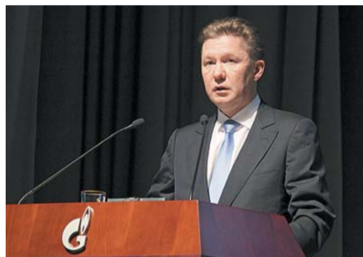
Алексей Миллер выступает с докладом

объектов в Бразилии и Ираке. Кроме того, в отчетном году подписано соглашение об обмене активами, по которому 50% доли в проекте по разведке и добыче нефти и газа в Северном море получает ОАО «Газпром».