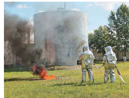
Ликвидация очага возгорания