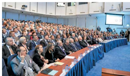
Акционеры ОАО «Газпром»

В прошлом году портфель зарубежных проектов Группы «Газпром» расширился за счет