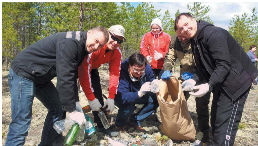
Сотрудники ООО «Югорскремстройгаз» на масштабном субботнике