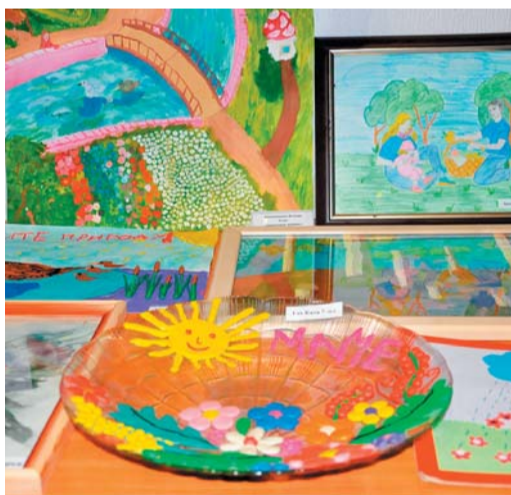
Выставка детского творчества