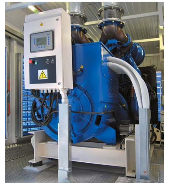
БКАЭ с электроагрегатом производства FG Wilson (ДОО «Электрогаз»)