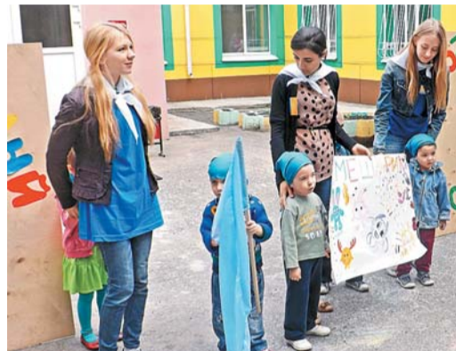
Праздник в Центре помощи семье и детям