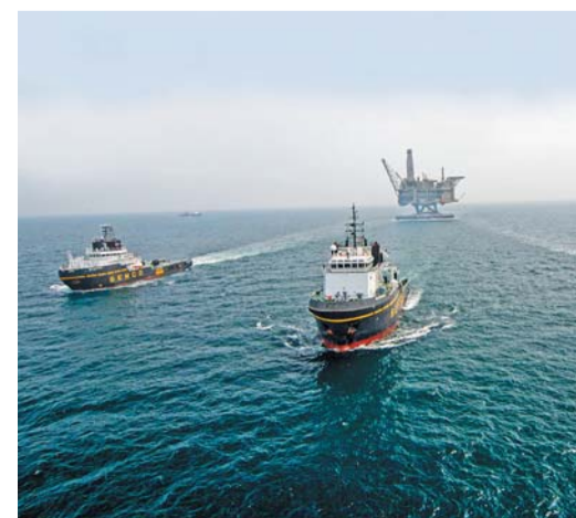
«Газпром» осваивает шельф

Акционеры избрали новый состав Совета директоров из 11 человек. Председателем Совета директоров ОАО «Газпром» избран специальный представитель Президента РФ по взаимодействию с форумом стран-экспортеров газа Виктор Зубков. Заместителем председателя Совета директоров компании по итогам голосования стал Председатель Правления Алексей Миллер.