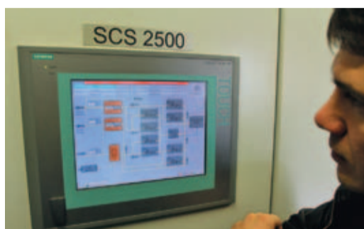
Мнемосхема на плоскочастотном мониторе стойки АСУ