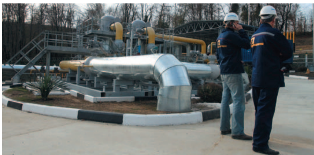
Узел очистки газа