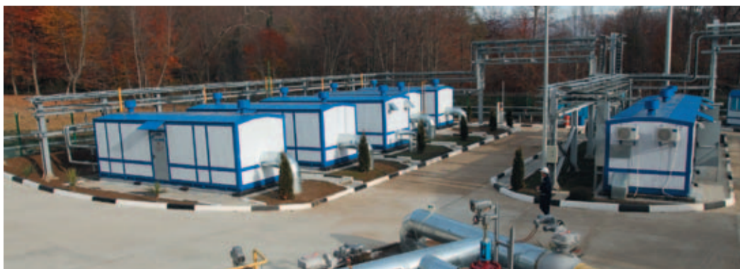
Блоки редуцирования и операторная

От этих газовых артерий разветвленная сеть газопроводов доставит голубое топливо жителям близлежащих поселков Адлерского района, а также на ключевые объекты спортивной, транспортной и туристической инфраструктуры, которая сейчас возводится в олимпийском Сочи.