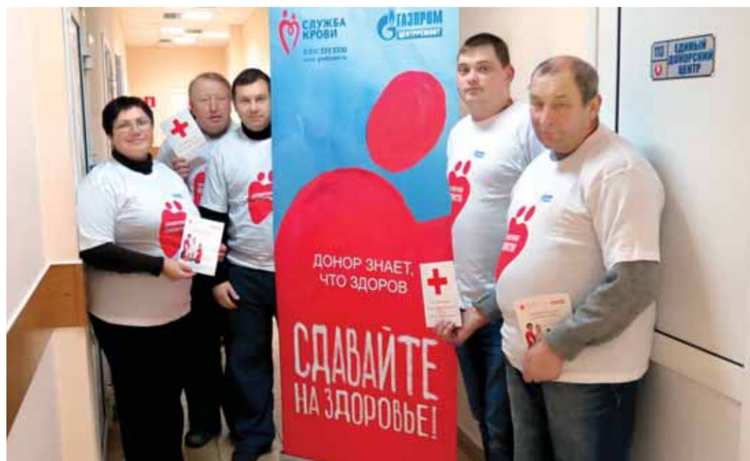
Доноры Завода «РТО» – филиала ОАО «Газэнергосервис»