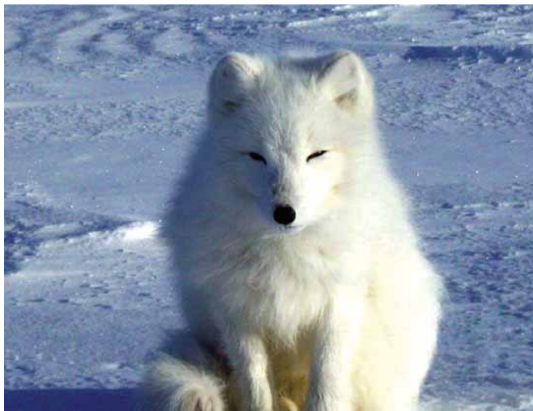
Фотография «Рыбки дай!» для конкурса ОАО «Оргэнергогаз»

ОАО «Оргэнергогаз» отчиталось о выполнении плана мероприятий по проведению Года экологии. В течение всего года сотрудники организовывали сбор макулатуры и ее передачу на переработку для вторичного использования, выходили на сезонные субботники, занимались благоустройством береговых и придорожных территорий. Ряд работников предприятия прошли обучение в области экологической безопасности и обращения с опасными отходами.