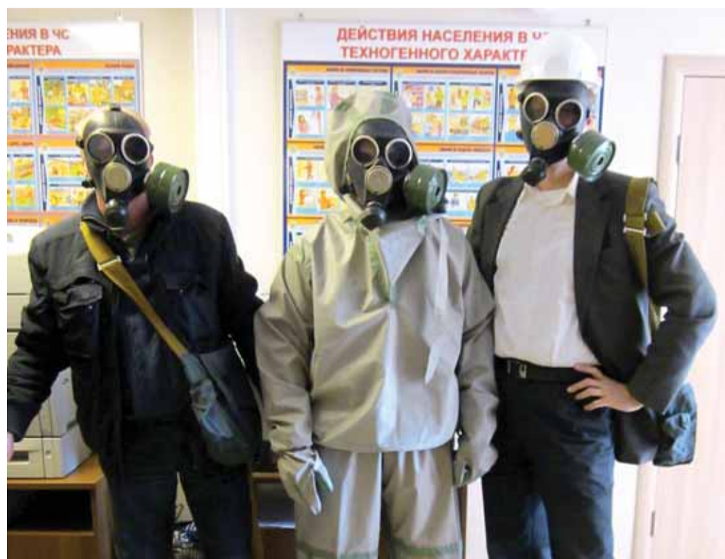
Работники Санкт-Петербургского филиала ДОО «Центрэнергогаз»

В Санкт-Петербургском филиале ДОО «Центрэнергогаз» проведена плановая объектовая тренировка по гражданской обороне по легенде «авария на железной дороге в 200 метрах от здания и разлив аммиака». Мероприятие организовано в соответствии с планом тренировок в филиалах Общества, а также в рамках проведения всероссийской тренировки по гражданской обороне.