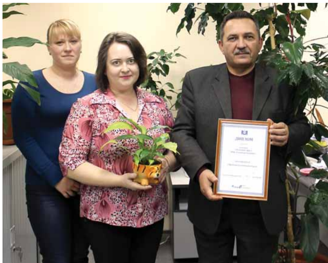
Сотрудники Производственного отдела ОАО «Газэнергосервис» – победители конкурса «Зеленый офис»

В ОАО «Газэнергосервис» подведены итоги корпоративного конкурса «Зеленый офис», организованного в рамках плана мероприятий по проведению Года экологии.