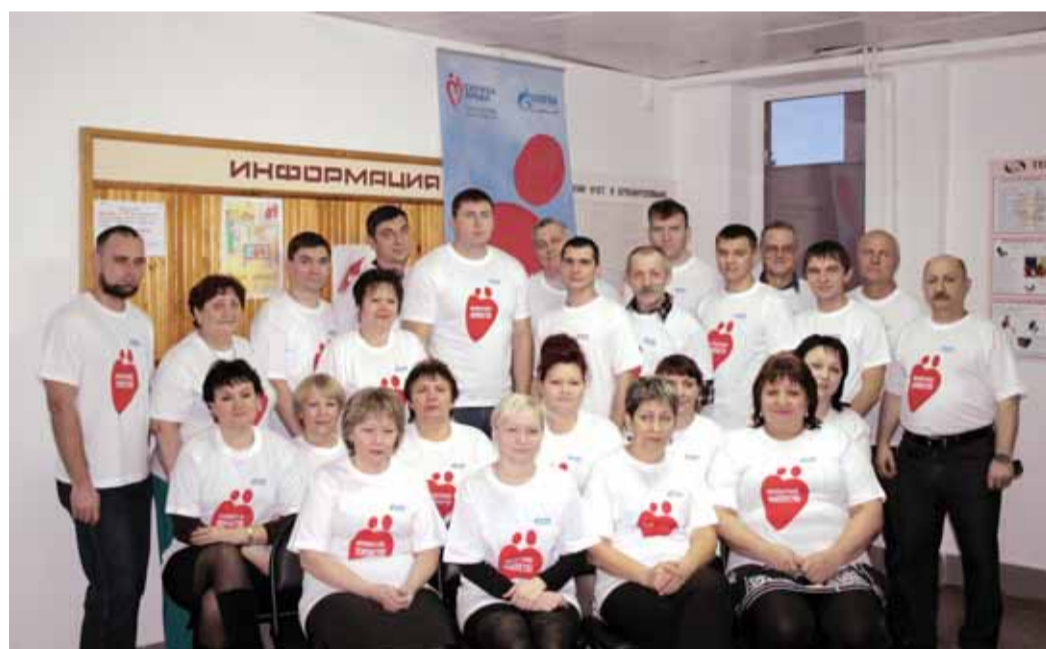
Доноры завода «Ротор»