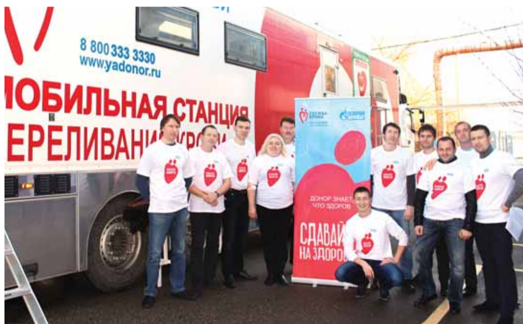
Доноры филиала «Афипэлектрогаз» ДОО «Электрогаз»