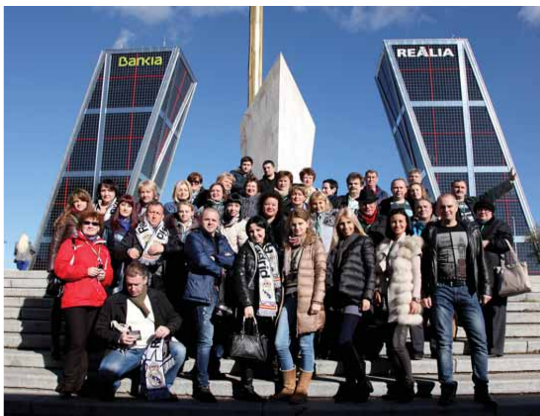
Сотрудники ОАО «Оргэнергогаз» в Мадриде

В ноябре для сотрудников ОАО «Оргэнергогаз» первичной профсоюзной организацией Общества были организованы экскурсионные поездки в Финляндию, Эстонию и Испанию.