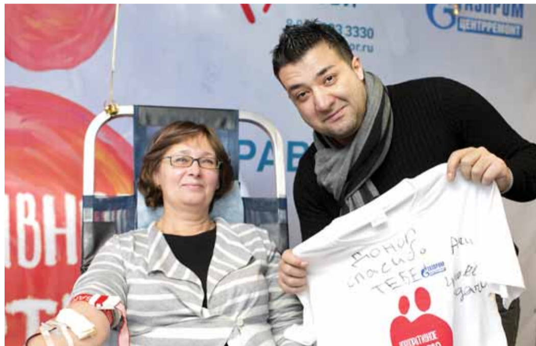
День донора в ООО «Газпром центрремонт»