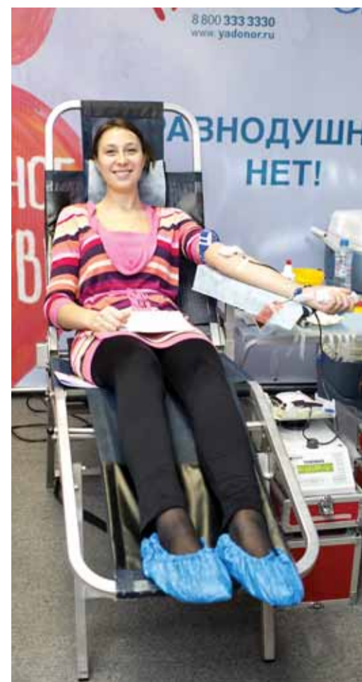
Донор знает, что здоров!