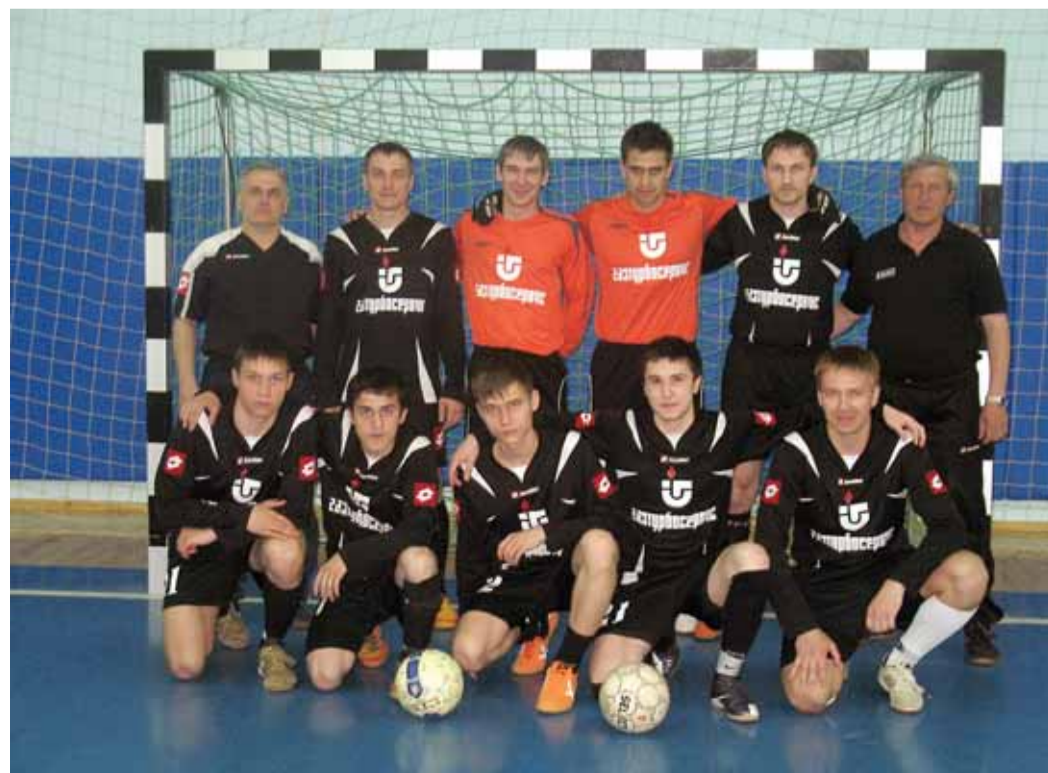
Команда ПИИ ОАО «Газтурбосервис» по футболу