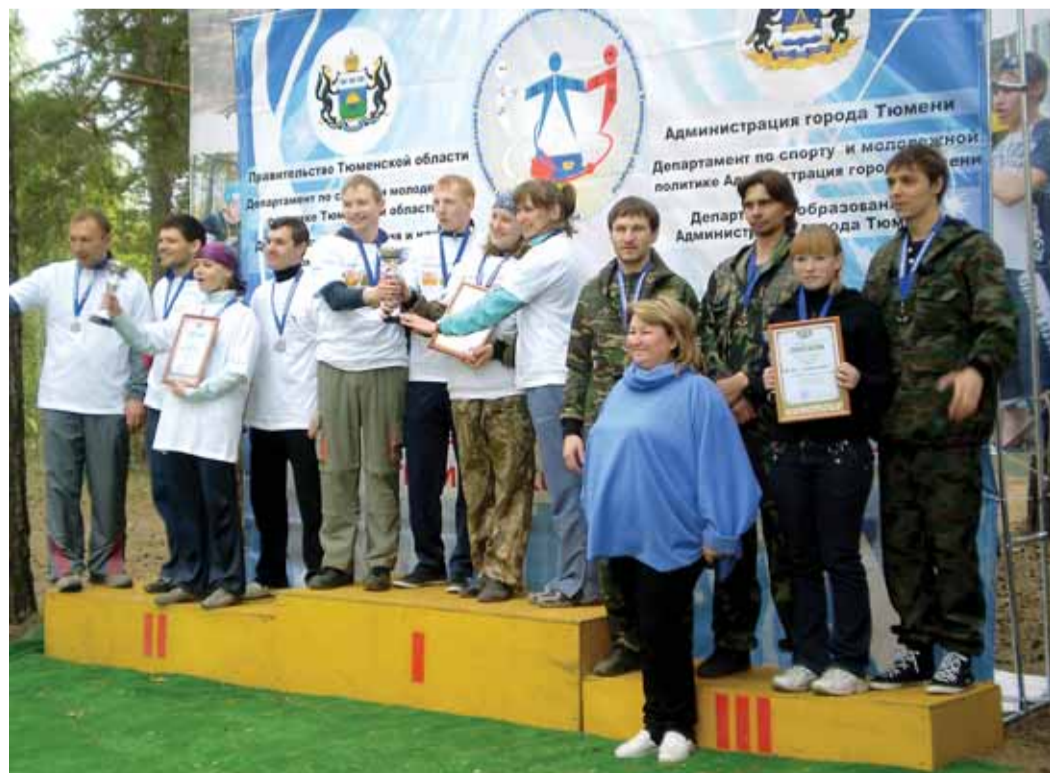
Команды ПИИ ОАО «Газтурбосервис» – призеры различных соревнований