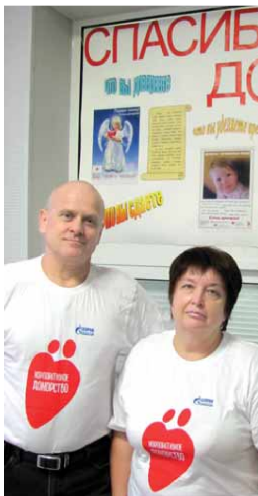
Почетные доноры Завода «Турборемонт»