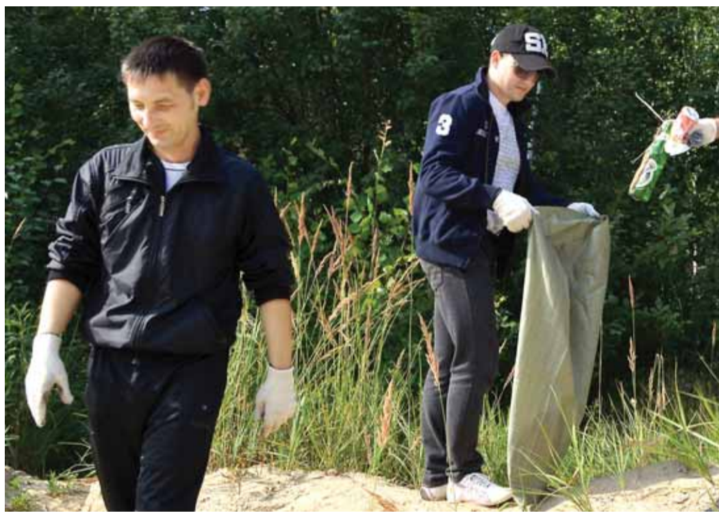
Организованный субботник в ОАО «Оргэнергогаз»

Более 1200 мероприятий за 365 дней. Программа природоохранных мероприятий, принятая ОАО «Газпром» в Год экологии, реализована в полном объеме. Не отстают и дочерние предприятия. Для ООО «Газпром центрремонт» год выдался насыщенным. В экологическом календаре холдинга отмечено множество ярких событий – от массовых субботников до тематических соревнований.